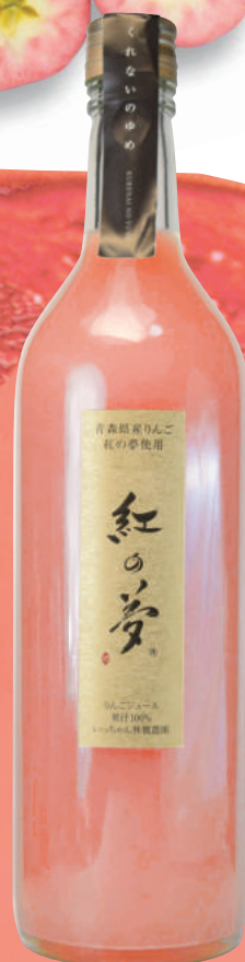
紅の夢 りんごジャム 120g 紅の夢 ジュース 180ml/750ml