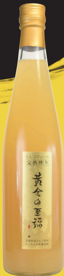
黄金の至福 ジュース 180ml/500ml